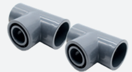
2 Raccords en T réduits Ø50mm / 32mm