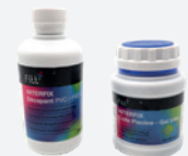
Colle PVC souple (bleue) + Décapant