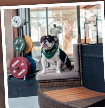
Banc confort et marche pied