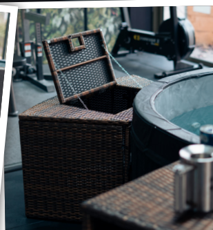
Habillage bloc moteur