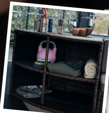
Étagères de rangement