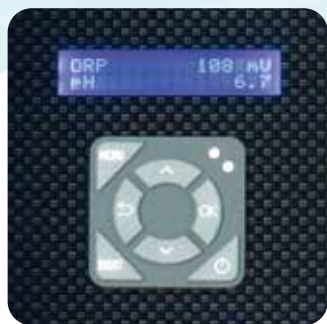
Écran LCD et pavé tactile