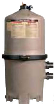
Cartouche de recharge, voir page 59.